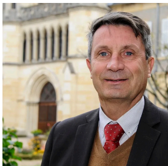
© Frédéric Lonjon - Article JDC - 15 Octobre 2017