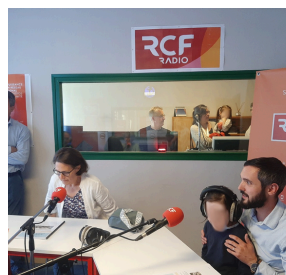
Enregistrement du texte