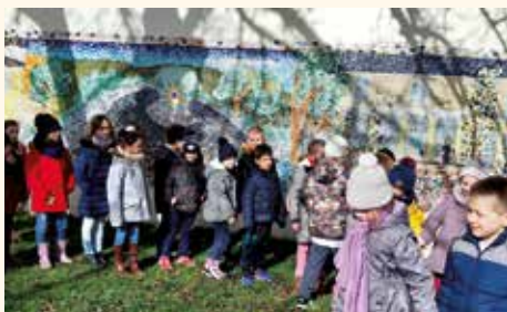
Les enfants découvrent la vie de Bernadette