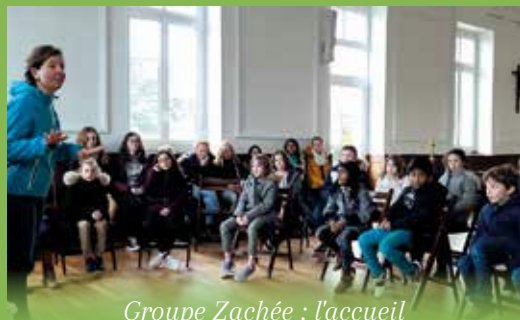
Groupe Zachée : l'accueil