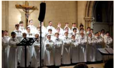
Les Petits Chanteurs à la Croix de Bois

LES PETITS CHANTEURS À LA CROIX DE BOIS sont venus remplir la chapelle de leurs voix cristallines. Ils ont repris des chants religieux du XII e siècle à aujourd'hui, comme une berceuse créole, une « chanson à bouche fermée » ou encore « Au clair de lune » écrit pour eux. Un moment magique qui a enchanté petits et grands.