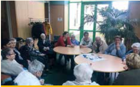
Journée des Bernadette

vraiment formidable, moderne et rapide. Et l'accueil chaleureux en terminant avec un goûter... ! Merci et à refaire. »