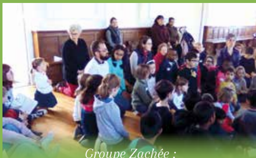
Groupe Zachée : découverte de la vie de Bernadette