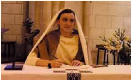
La lecture d'une lettre de Bernadette