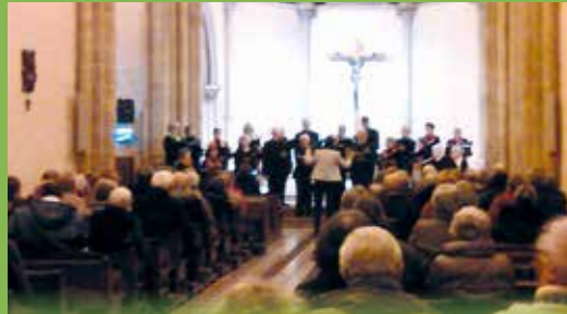
Concert de la chorale Voix humaine