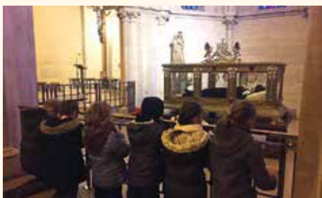
Les enfants auprès de sainte Bernadette