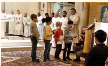
La messe animée par les enfants

Tout au long de la semaine, LES ENFANTS DE L'ÉCOLE SAINTE-BERNADETTE sont venus pour (re)découvrir l'histoire de sainte Bernadette, ils ont également préparé des dessins ou des phrases qui ont été distribués à la fin de la messe du MARDI 18 FÉVRIER. LES CLASSES DE CE2 ONT PRÉPARÉ ET ANIMÉ CETTE MESSE où se sont retrouvés