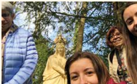
Rallye selfie : découverte du jardin