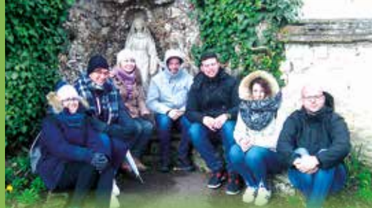
Des jeunes italiens du Service civil