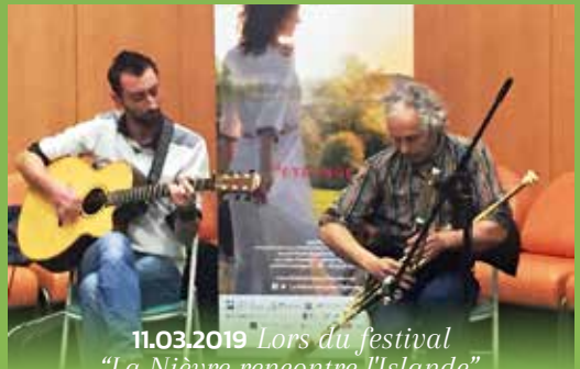
11.03.2019 Lors du festival "La Nièvre rencontre l'Islande"