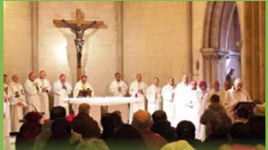
03&04.01.2019 Pèlerinage des évêques de France

Les membres de l'aumônerie de la Maison d'arrêt