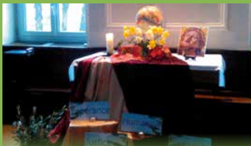
les vendredis de Carême Prière avec la CCFD - Terre Solidaire