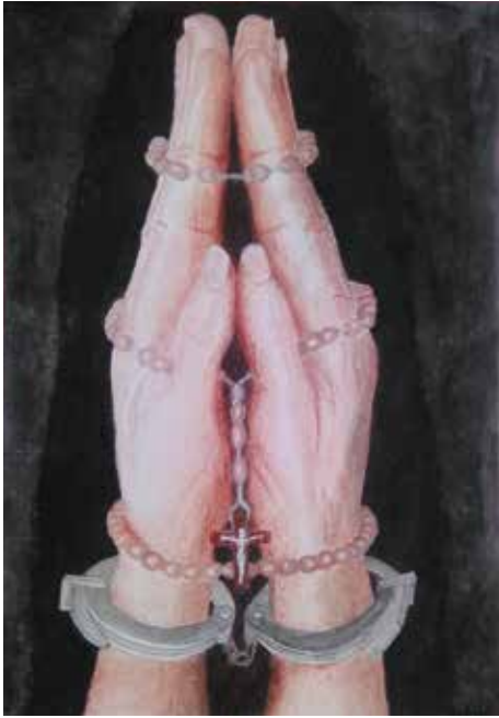
Le dessin d'un détenu

De belles prières ont ensuite été exprimées et des dessins réalisés.