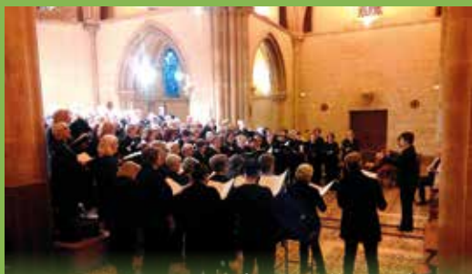
26.04.2019 Une amitié franco-allemande avec les chorales Crescendo et Bänder Kantorei